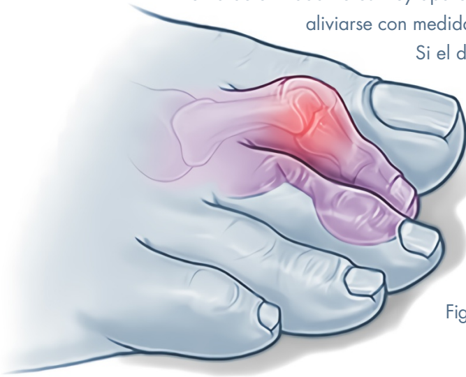
Figura 2: Dedos en martillo

Si el dolor impide caminar o calzarse se puede valorar la intervención quirúrgica. La intervención puede variar según el tipo de patología y muchas veces acompaña al hallux valgus.